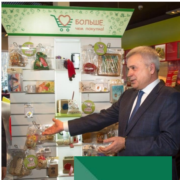
Вагит Алекперов, Учредитель Фонда «Наше Будущее»

Фонд «Наше будущее» — первая организация, системно развивающая социальное предпринимательство в России.